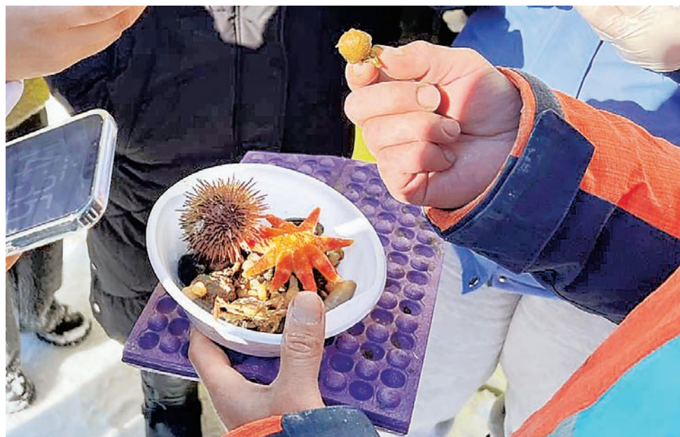
↑ Улов команды «Упаходы», отмеченной в номинации «Видовое разнообразие». Её участники добыли морскую звезду, морского ежа, трубача, крабика, маленькую упу и ещё один вид асцидии, который эскимосы называют миллюкутак, а также морской виноград (водоросль, получившая название из-за своего внешнего сходства с гроздьём винограда).