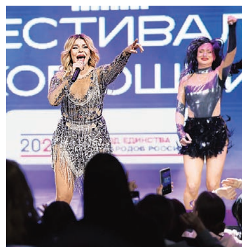
↑ Самой ожидаемой звездой культурной программы была Лада Дэнс – певица исполнила свои известные хиты и по-настоящему зажгла публику.