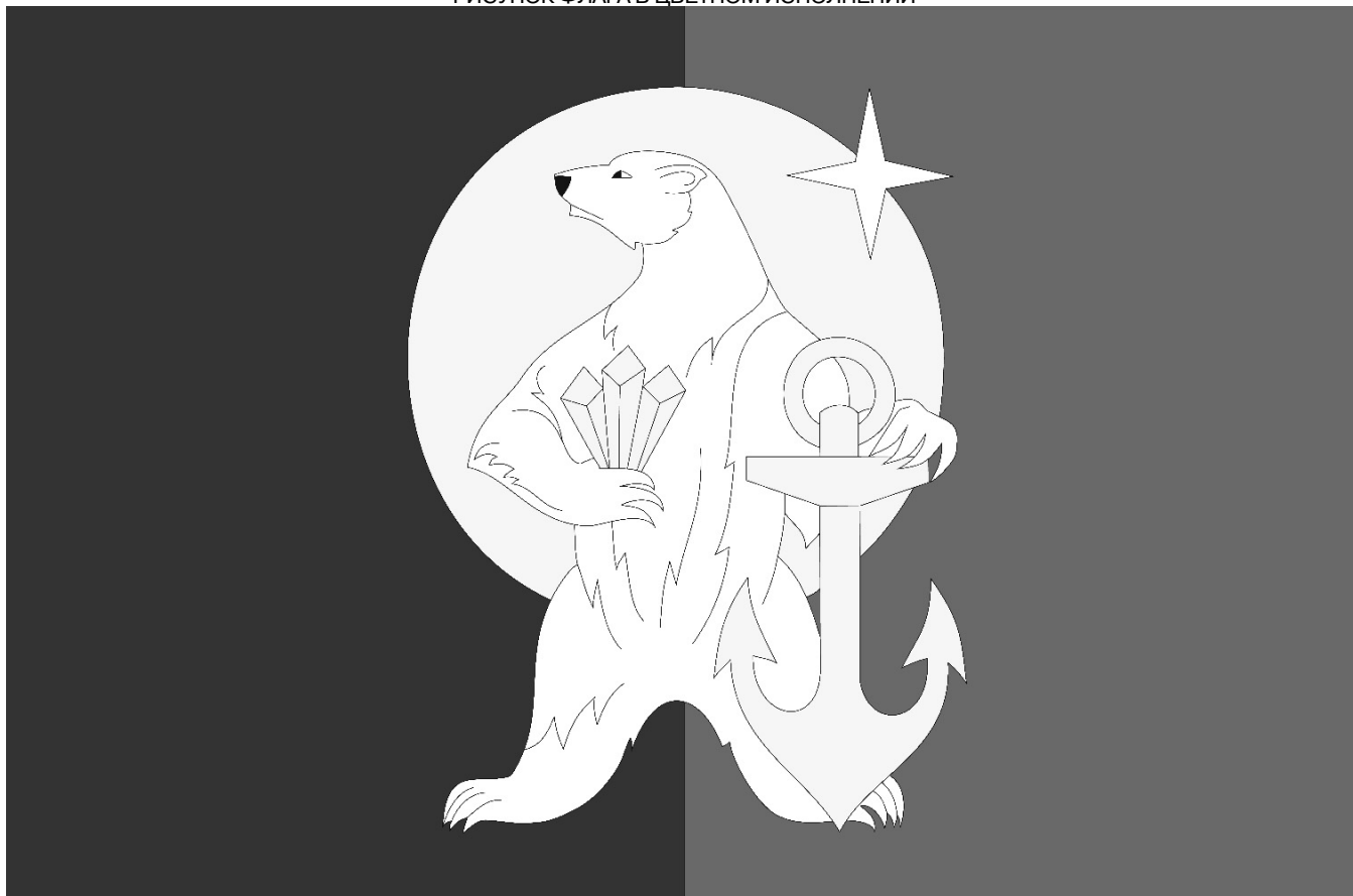
РИСУНОК ФЛАГА В ЦВЕТНОМ ИСПОЛНЕНИИ