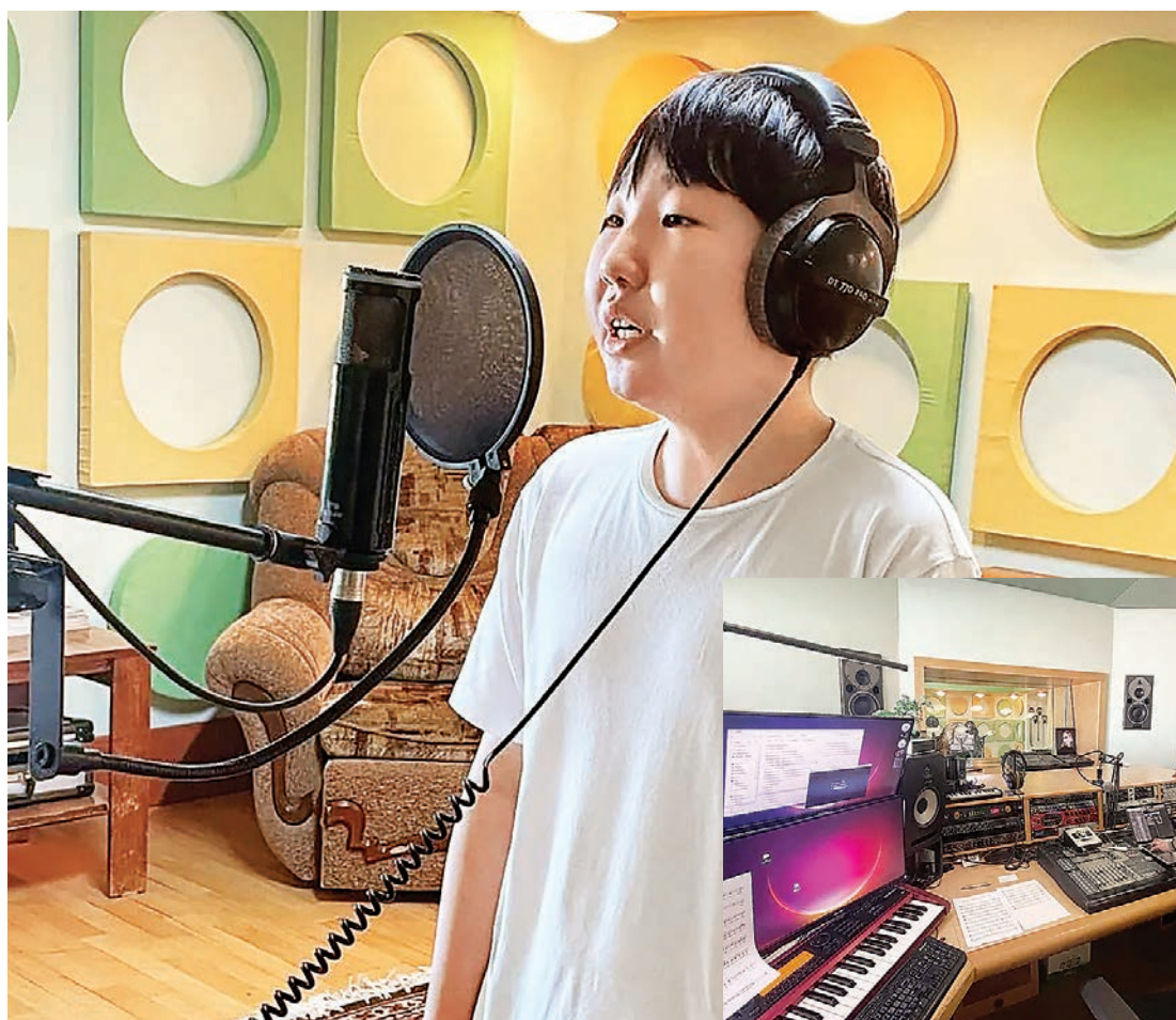
← В Окружном Доме народного творчества специалисты московской студии Gonchar Production записали порядка 40 юных вокалистов, исполняющих гимн Чукотки.