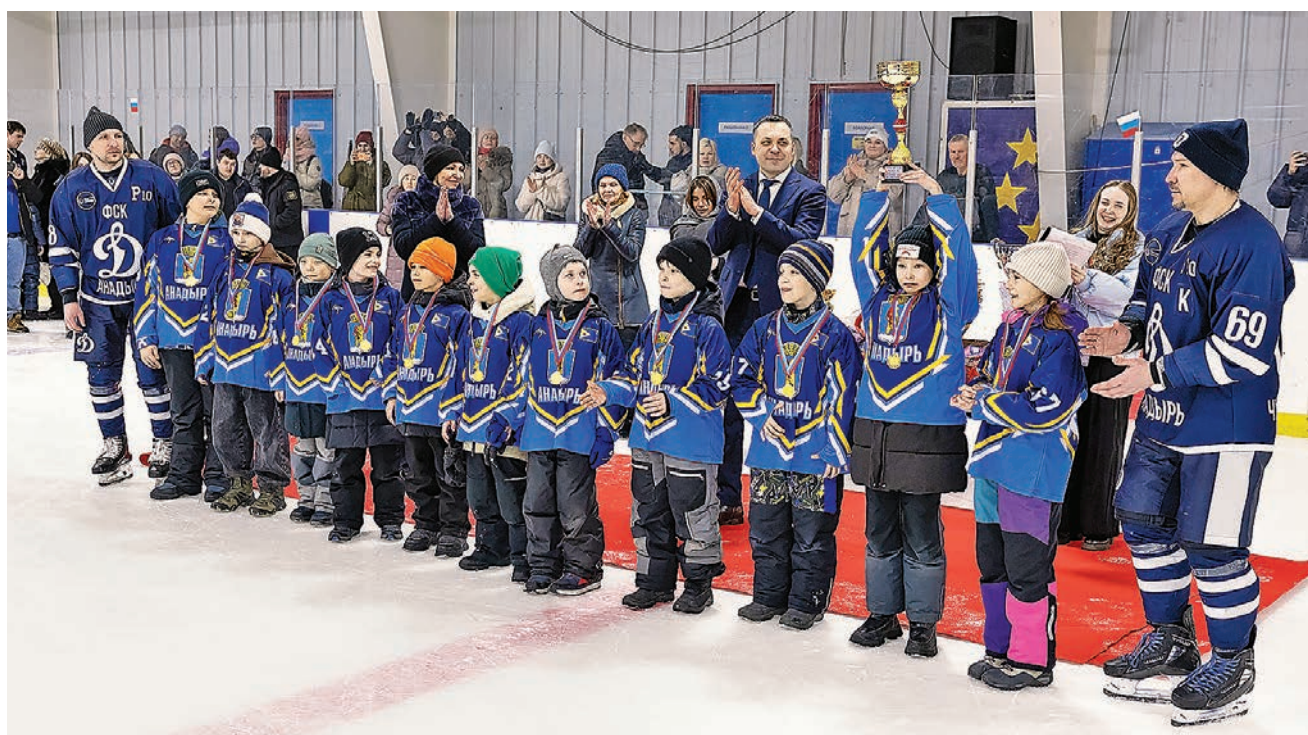
↑ В окружном первенстве среди детей, игры которого по накалу страстей ничуть не уступали встречам взрослых команд, золото завоевали юные хоккеисты Анадыря.

Шайбу! Большой кубок чемпионата округа по хоккею вновь отправился в Билибино, ледовая дружина которого взяла реванш за прошлогоднее поражение у динамовцев Анадыря