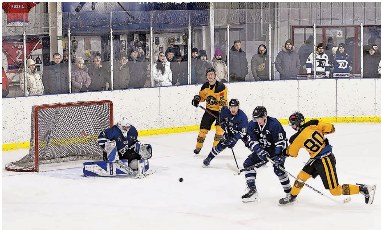
↑ Самые жаркие ледовые баталии развернулись за обладание Большим кубком: три встречи провели принципиальные соперники ФСК «Динамо-Анадырь» и билибинский «Луч», хоккеисты которого на этот раз оказались сильнее.

– «Авиаторы» достойно играли, ПСВ – ожидаемо, «Водник» – сенсация, «Энерги» – молодцы, так как подростки старались играть наравне со взрослыми. Интересные матчи прошли с «Водником» и «Авиаторами» – ледовые баталии до последней секунды, переживали за них. Провиденцы вообще прибыли на первый матч прямо с вертолёта и сразу одержали победу – 5:0.