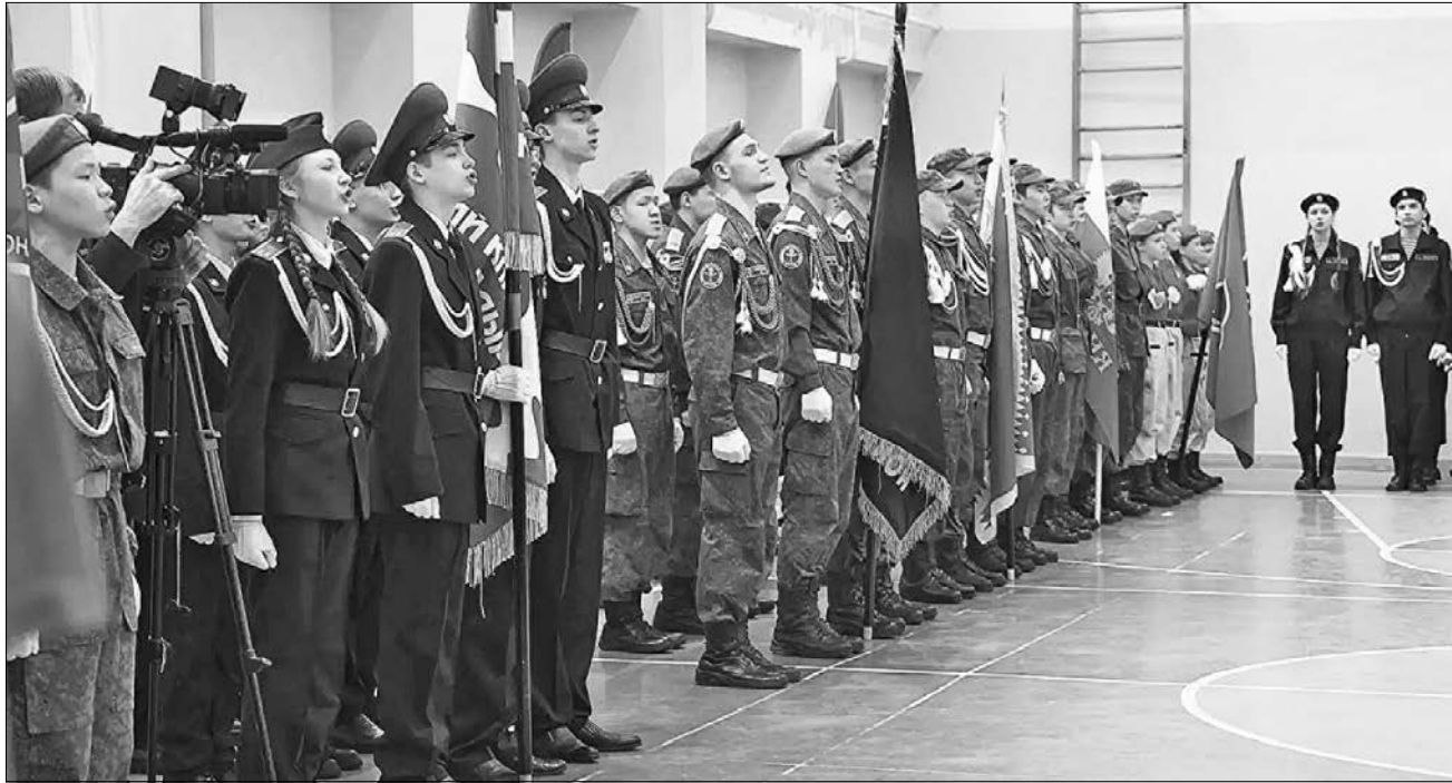
ФОТО: MAX.RU/DEPOBR, ЧУКОТКА

«Зарница 2.0»: Одиннадцать команд из всех муниципалитетов округа участвуют в региональном этапе всероссийской военно-патриотической игры, проходящем в Анадыре