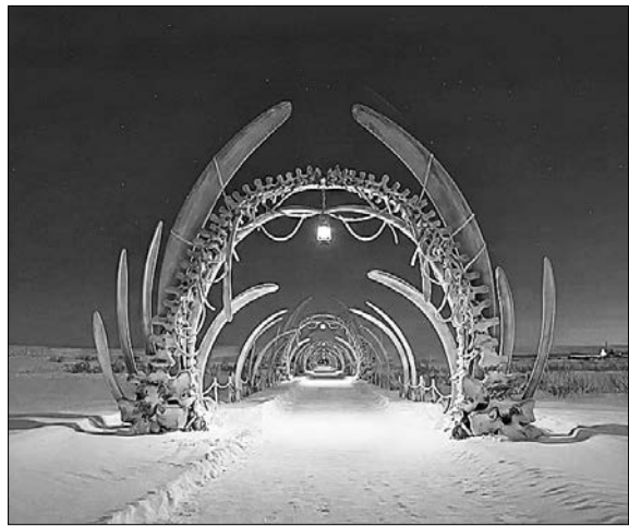
↑ Проект по обустройству этнодеревни «Домик рыбака» предусматривает установку в этой локации аналога знаменитой Китовой аллеи.

Стали известны итоги архитектурного конкурса «Арктика. Перезагрузка», участникам которого предлагалось разработать концепции развития трёх территорий Анадыря. В общей сложности поступило более 70 заявок с проектами благоустройства села Тавайваам, этнодеревни «Домик рыбака» и застройки локации «Коса Песчаная». Лучшей и наиболее отвечающей чаяниям северяян признана работа архитектурного бюро AV CD из Ростова-на-Дону.