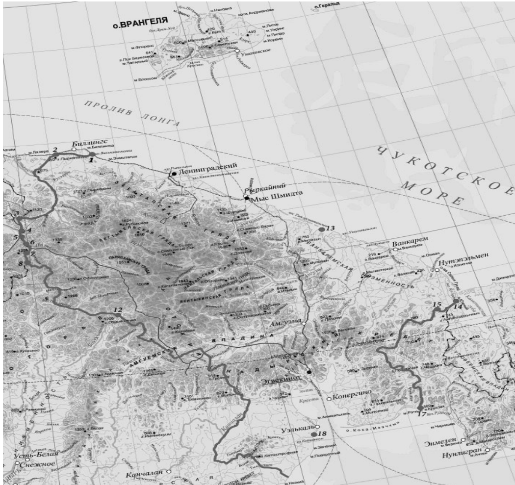
Приложение 2 к Закону Чукотского автономного округа «О наделении муниципального образования городской округ Эгвекинот статусом муниципального округа»