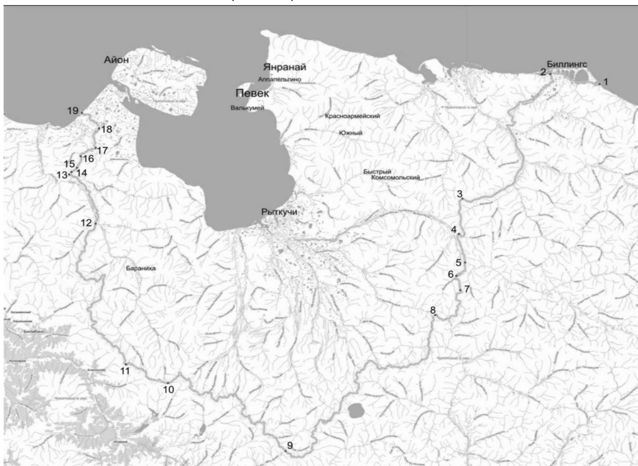
КАРТА-СХЕМА ГРАНИЦЫ МУНИЦИПАЛЬНОГО ОКРУГА ПЕВЕК

Приложение 2 к Закону Чукотского автономного округа «О наделении муниципального образования городской округ Певек статусом муниципального округа»