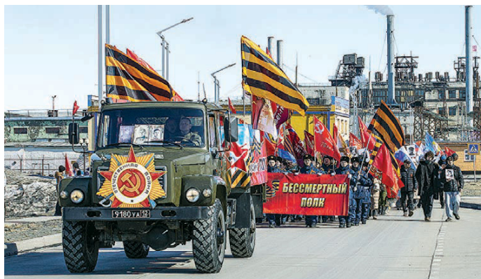
↑ К шествию «Бессмертного полка» в заполярном Певеке присоединилась половина жителей самого северного города России.

В торжественной части мероприятия, в том числе в выносе копий штандартов