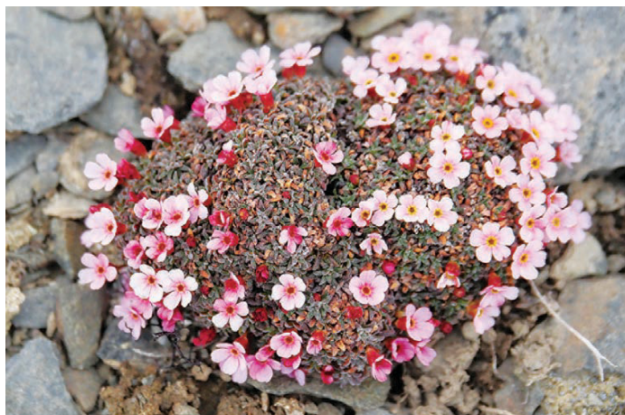
↑ Арктическая весна начинается с появления нежно-розовых цветков проломника охотского, образующего густые дернины на каменистых осыпях, сухих склонах и прибрежных галечниках – там, где снег сходит раньше всего.