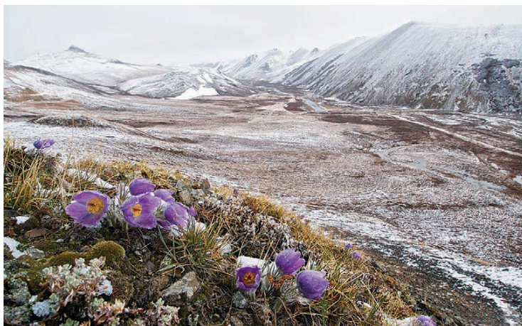
↑ За поникающие цветки прострел многонадрезный, появляющийся на Чукотке сразу после схода снега, называют сон-травой. По легенде, если положить это растение под голову спящему, тот увидит вешние сны. В старинных травниках растение отмечено как седативное (успокаивающее) средство, а в некоторых – и как снотворное.

Арсенал приспособлений, которым пользуются эти растения, впечатляет своей продуманностью. Прижимаясь к земле или сбиваясь в плотные подушки, они уходят от ледяного ветра и греются от почвы, аккумулирующей солнечное тепло. Густые волоски защищают от мороза, удерживают влагу и улавливают воду прямо из тумана, как живой конденсатор. Чашевидные цветки фокусируют солнечные лучи в своём центре, создавая внутри микроклимат на пять-десять градусов теплее окружающего воздуха. Это одновременно ускоряет созревание пыльцы и привлекает насекомых-опылителей, которым тоже нужно где-то греться. А от появления бутона до вызревания семян у многих видов проходит всего три-четыре недели, и вся эта сложная система запускается на первой же талой воде, используя её как стартовый капитал для нового сезона.